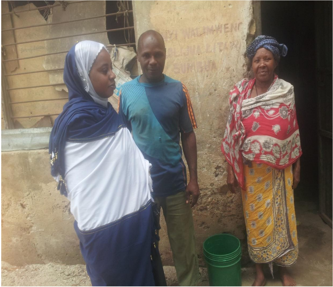
Mtafiti (Upande wa kuchoto mwenye mtandio wenye rangi nyeupe na bluu) akiwa na wakaazi wa nyumba yenye kuchorwa semi za kutani