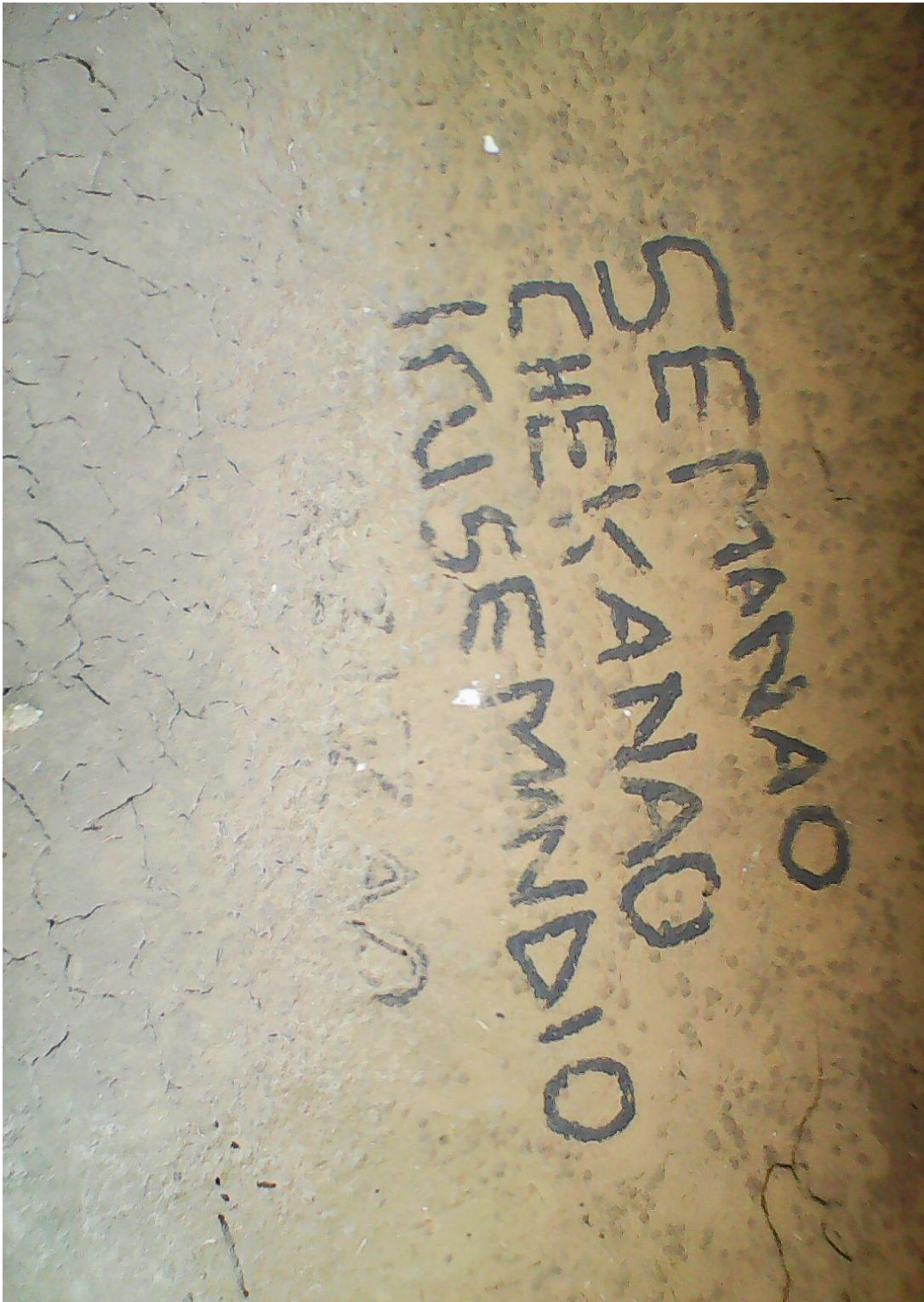
Semi katika Ukuta wa Nyumba ya Kijiji