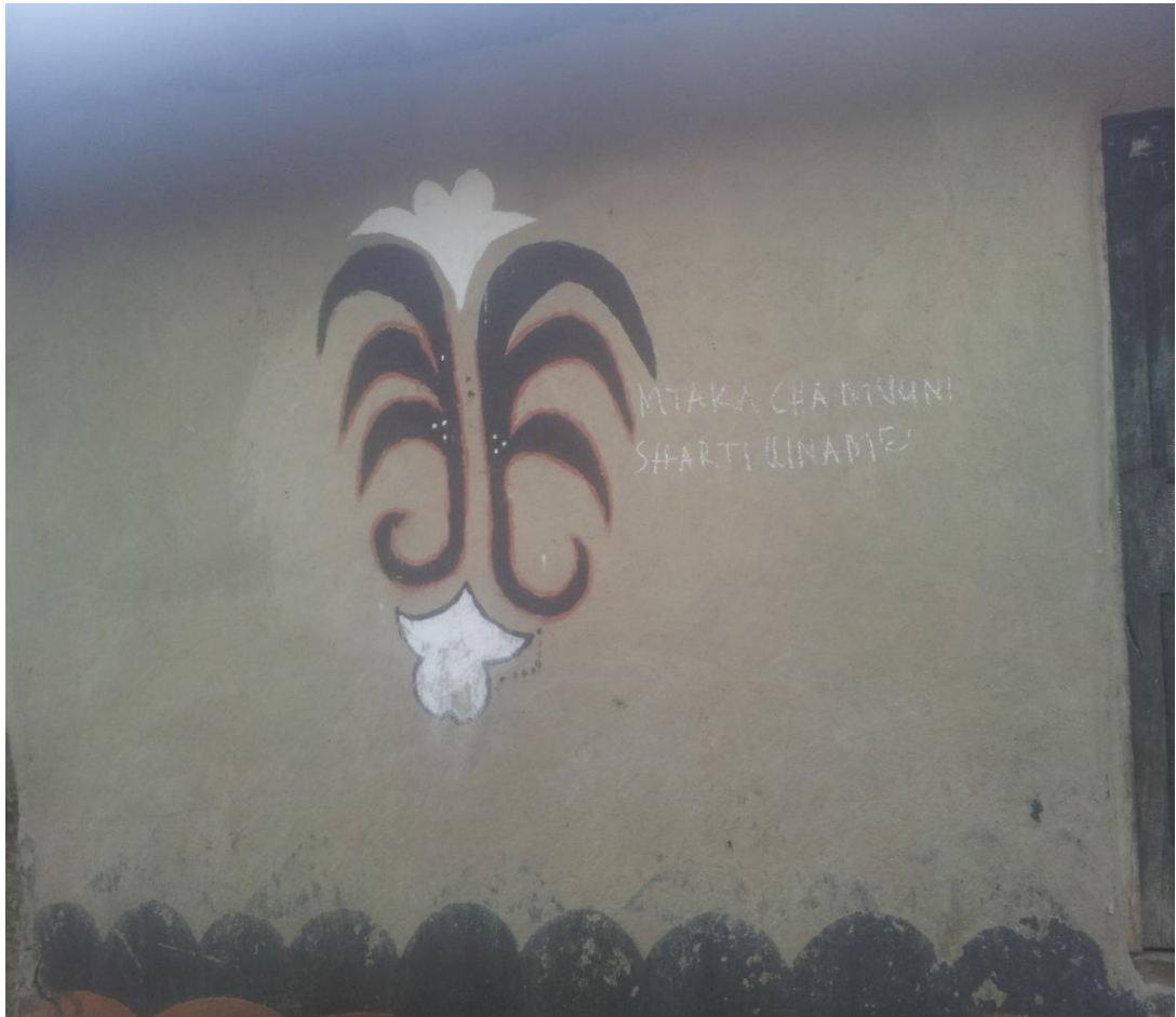
Semi katika Ukuta wa Nyumba ya Kijiji